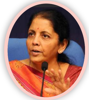
Smt. Nirmala Sitharaman Hon'ble Minister of Finance and Minister of Corporate Affairs Government of India

The Director and the entire community at MDNIY extend sincere gratitude to the Hon'ble Union Minister for her genuine interest in Yoga, active participation in MDNIY activities, and dedicated efforts in promoting the Yoga system.