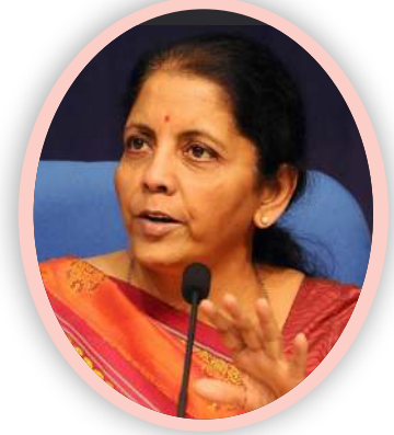
श्रीमती निर्मला सीतारमण माननीय वित्त मंत्री और कॉर्पोरेट कार्य मंत्री, भारत सरकार

अपने राजनीतिक योगदान से परे श्रीमती सीतारमण योग में गहरी रुचि दिखाती हैं। जंतर-मंतर नई दिल्ली में 8वें और 9वें अंतरराष्ट्रीय योग दिवस कार्यक्रमों में उनकी भागीदारी इस प्राचीन अभ्यास को बढ़ावा देने के प्रति उनकी प्रतिबद्धता को दर्शाती है। भारत सरकार के वित्त मंत्रालय द्वारा देश भर के 75 ऐतिहासिक और सांस्कृतिक स्थलों पर योग उत्सव का आयोजन किया गया, जिसमें बड़ी संख्या में प्रतिभागियों ने भाग लिया।